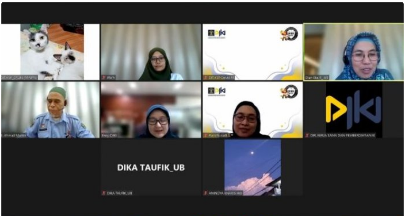
Rapat Persiapan Patent Examiners Go to Campus

KOTA MALANG - Universitas Brawijaya (UB) ditunjuk oleh Direktorat Jenderal Kekayaan Intelektual (DJKI) sebagai salah satu universitas yang akan mengikuti Patent Examiners Go to Campus. Patent Examiners Go to Campus merupakan salah satu Program Unggulan DJKI Tahun 2023 sebagai upaya meningkatkan permohonan paten dalam negeri.