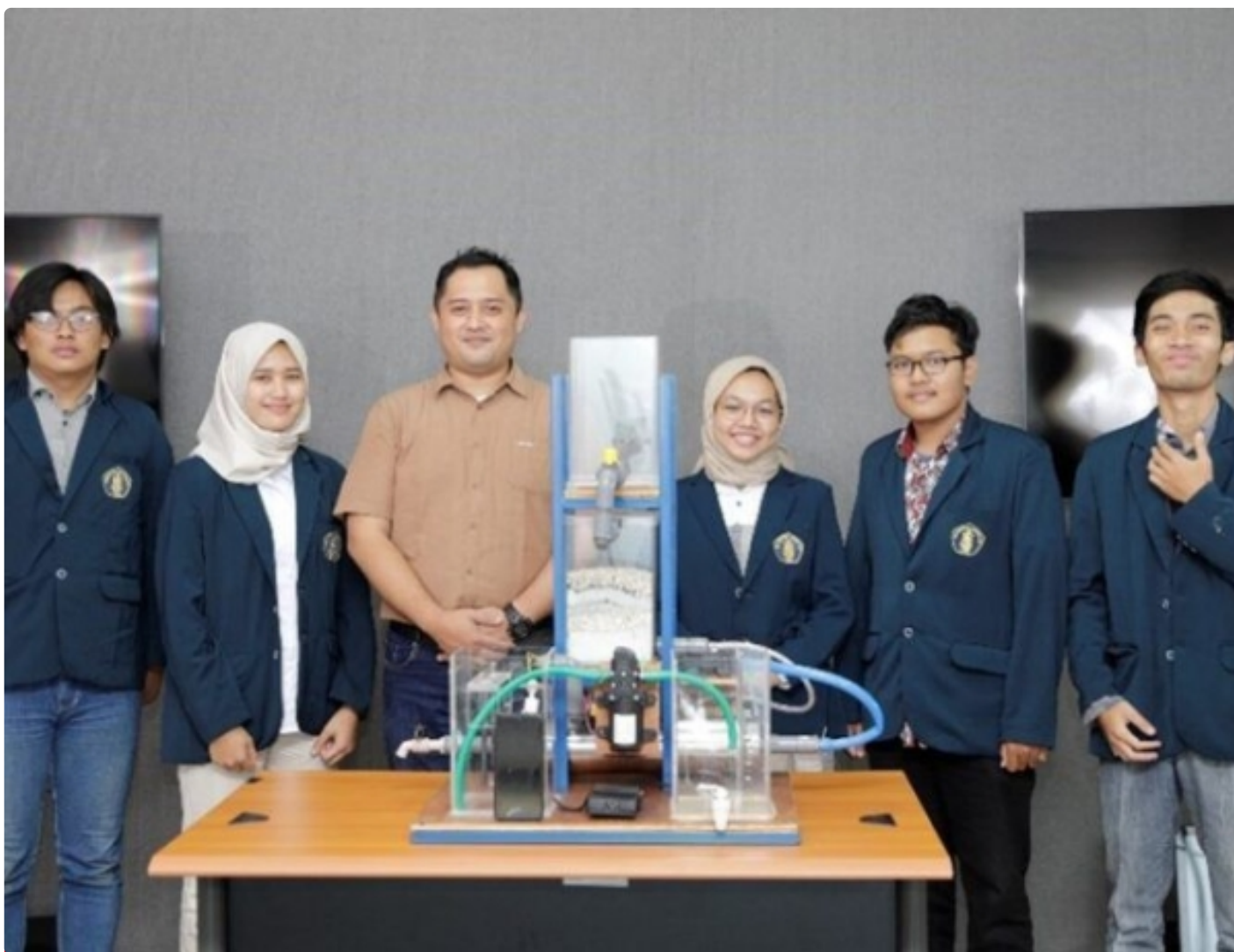
5 Mahasiswa UB ciptakan alat pemanen air hujan siap minum